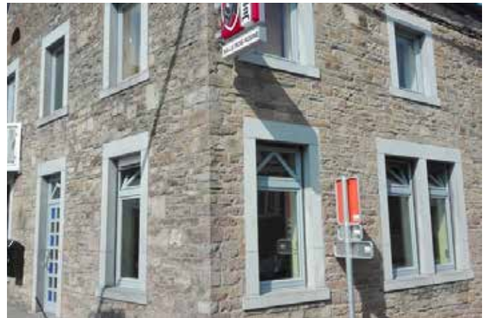
Rénovation abribus à Pont-de-Bonne

Les ouvriers s'occupent aussi de l'entretien des bâtiments communaux. Ils réalisent des travaux de peinture : cette année, ils ont repeint le module en bois de l'école des Gottes, ainsi que les châssis de la salle Bois Rosine qui a retrouvé belle allure !