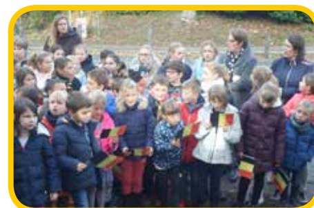
: Modave, Vierset et Strée. Le 100ème anniversaire de l'Armistice était aussi l'occasion de mettre à l'honneur deux

soldats victimes de cette guerre et morts sur le territoire de Modave.